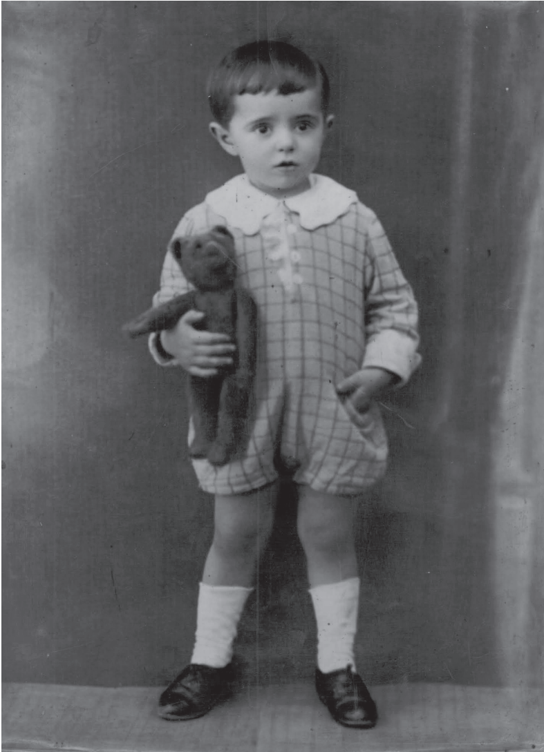
Stanisław Lem de niño, Leópolis, década de 1920.